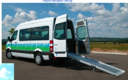
- Rampe repliable relevable en 3 éléments 300 kg.