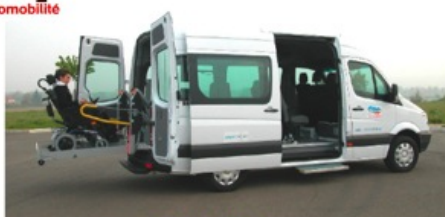
- Hayon élévateur 350 kg